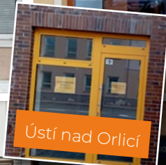
Ústí nad Orlicí